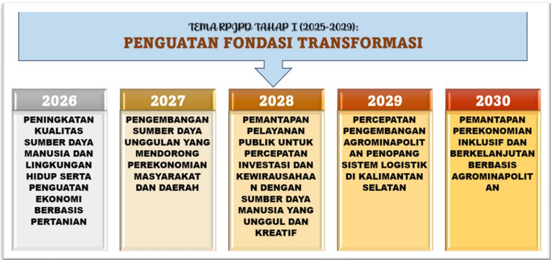
Gambar 2.2 Tema RKPD Kabupaten Hulu Sungai Utara Tahun 2026 dalam Penahapan Pembangunan Jangka Menengah